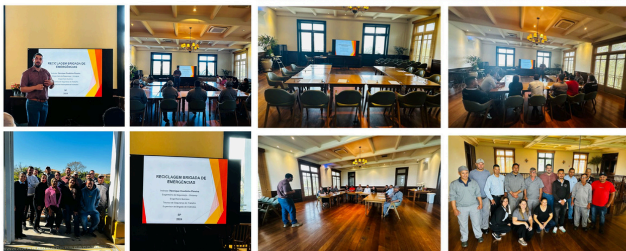
FOTO DE UMA DAS TURMAS DO CURSO DE BRIGADA 2024